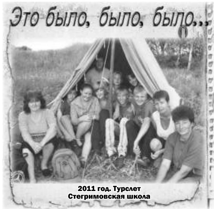
2011 год. Турслет Стегримовская школа