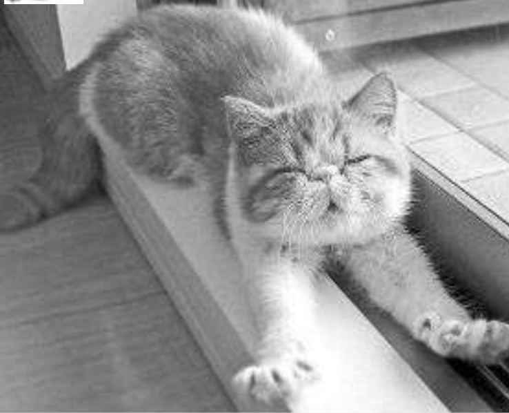
Что-то скучно стало жить... Нужно что-то натворить!...

Из сотни тех, кто ГОВОРИТ КРАСИВО, Я ВЫБЕРУ ТОГО, КТО МОЛЧА ДЕЛАЕТ ДЕЛА!